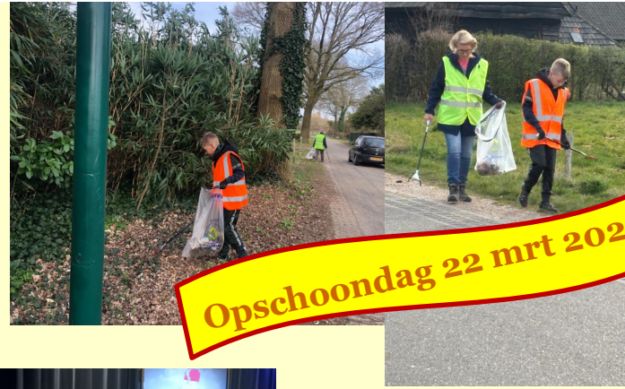
Opschoondag 22 mrt 2025