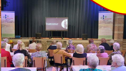
10 maart 2025