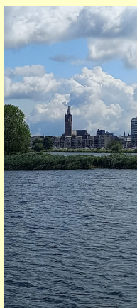
Busreis 4 juli 2024