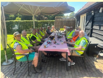
Barendonk 26 juni