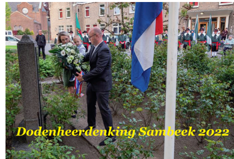
Dodenherdenking Sambeek 2022