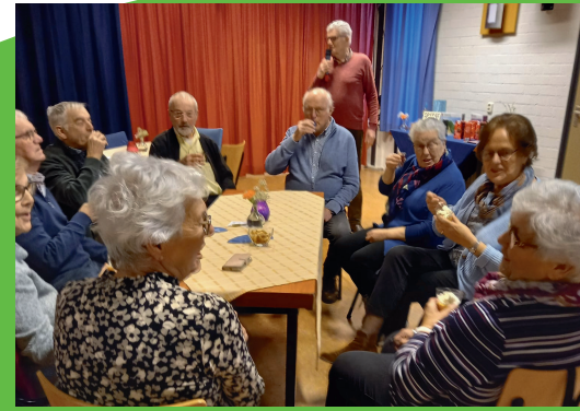
13 januari 2023